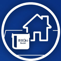
MEGa Beutel auf Ihrem Grundstück aufstellen