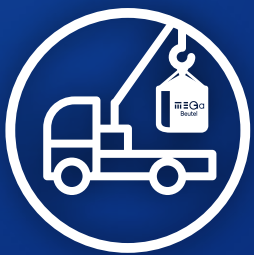
Abholung innerhalb von drei Werktagen