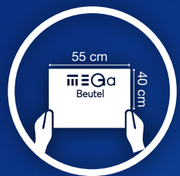
MEGa Beutel kaufen